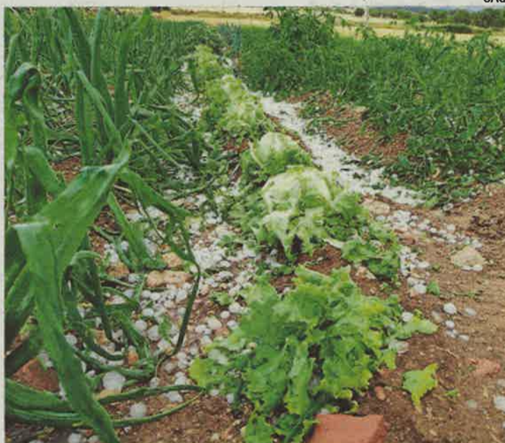
Huerta destrozada. Campo de Torralbilla afectado por el granizo.

También se estropearon campos de maíz y de patatas.